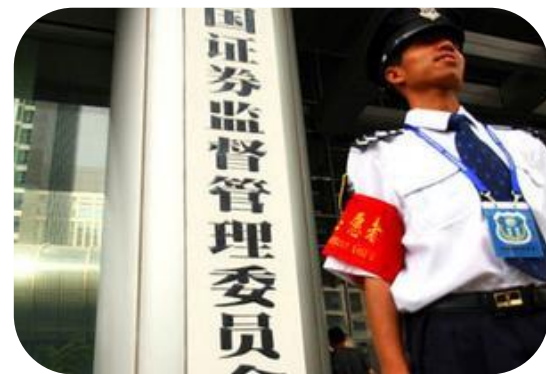
中国证券监督管理委员会