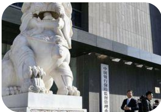
中国银行保险监督管理委员会